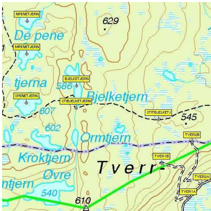
Kartutsnitt med veipunkter, før turen

Jeg har bestandig likt å planlegge fisketurer og andre turer i skog og mark. Ved fisketurer til nye områder synes jeg det er greit å prate litt med andre som har vært i området hvis jeg kjenner til noen. Jeg studerer også kartene ganske grundig. Det er mye god informasjon i det. Hvor langt er det til neste vann? Er det noen elver eller bekker mellom noen vann? Er det noen fine loner der? Etter at jeg kjøpte en enkel GPS (uten mulighet for å laste ned kart) og et par forskjellige kartprogram til PC'n for et par år siden har det blitt enda morsommere å planlegge turer. Det er lett å sitte på PC'n og studere kart, plote inn veipunkter, slik som start på stier, alle interessante vann i området, klopper over elver, mulige leirplasser etc.