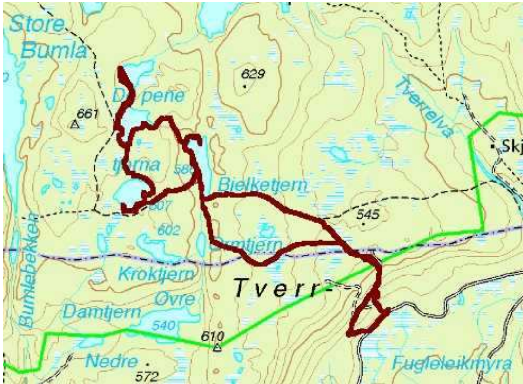
Sporlogg fra rundturen til Bjelketjern og De pene tjerna

På denne turen fikk jeg også noen fisker, den største på 750 gr, dette bekreftet det positive inntrykket fra området.